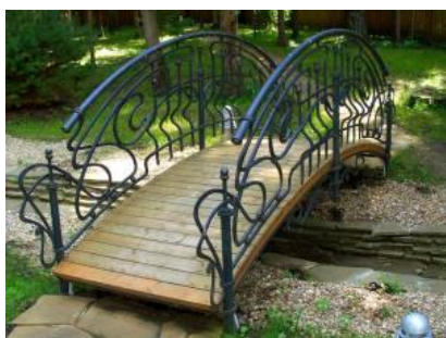
Кованый мостик КМ 11

Размер мостика может быть любым, стоимость по индивидуальным размерам рассчитывается дополнительно.