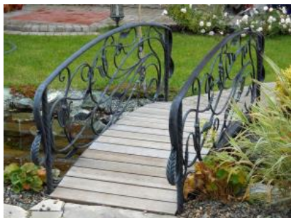
Кованый мостик КМ 10