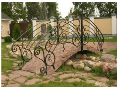
Кованый мостик КМ 12