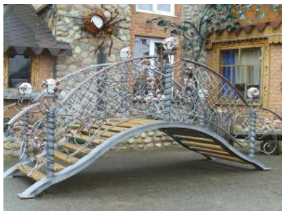
Кованый мостик КМ 8