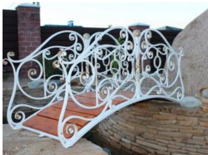
Кованый мостик КМ 9

ЦЕНА РАССЧИТАНА ЗА СЛЕДУЮЩУЮ КОМПЛЕКТАЦИЮ МОСТИКА: РАЗМЕР 3,5м*1,10м ОСНОВАНИЯ МОСТИКА: КАРКАС с деревянными ступеньками ОГРАЖДЕНИЕ МОСТИКА: С ДВУХ СТОРОН Материал: основание мостика -профильная труба 80x80, доска сосна, рисунок-полнотелый квадрат 16x16, прут d 12 мм, d 6мм, полоса 16x4, плафоны для светильников, поручень-профильная труба 40x40. Рисунок украшен коваными листьями и цветами. Ковка исключительно ручная без использования объемных штампованных элементов. Краска кузнечная (цвет любой по RAL), нанесена декоративная патина (цвет выбирается в соответствии с цветом основной покраски изделия). Размер мостика может быть любым, стоимость по индивидуальным размерам рассчитывается дополнительно. ЦЕНА УКАЗАНА ТОЛЬКО ЗА МОСТИК, ДРУГИЕ КОВАНЫЕ ИЗДЕЛИЯ, ПРЕДСТАВЛЕННЫЕ НА ФОТО, РАССЧИТЫВАЮТЯ ДОПОЛНИТЕЛЬНО.