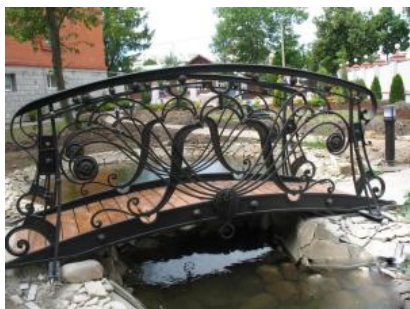
Кованый мостик КМ 13

ОГРАЖДЕНИЕ МОСТИКА: С ДВУХ СТОРОН Материал: основание мостика -профильная труба 60х60, рисунок- полнотелый квадрат 16х16, поручень-полоса декоративная 50х6. Ковка исключительно ручная без использования объемных штампованных элементов. Краска кузнечная (цвет любой по RAL), нанесена декоративная патина (цвет выбирается в соответствии с цветом основной покраски изделия). Размер мостика может быть любым, стоимость по индивидуальным размерам рассчитывается дополнительно.