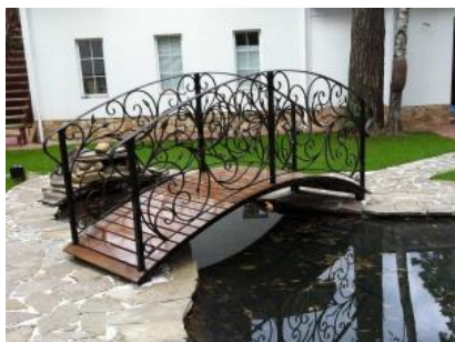
Кованый мостик КМ 19

ЦЕНА РАССЧИТАНА ЗА СЛЕДУЮЩУЮ КОМПЛЕКТАЦИЮ МОСТИКА: РАЗМЕР 3,0м*1,10м ОСНОВАНИЯ МОСТИКА: КАРКАС ЗАШИТ ДОСКАМИ ОГРАЖДЕНИЕ МОСТИКА: С ДВУХ СТОРОН Материал: основание мостика -профильная труба 60x60, доска сосна, рисунок-полнотелый квадрат 12x12, поручень-профильная труба 40x25, столбы- профильная труба 50x50. Ковка ручная с использованием объемных штампованных элементов. Применены декоративные кованые хомуты и клепки. Буквы в рисунке могут быть заменены на другие, либо просто на кованые элементы. Краска кузнечная (цвет любой по RAL), нанесена декоративная патина (цвет выбирается в соответствии с цветом основной покраски изделия). Размер мостика может быть любым, стоимость по индивидуальным размерам рассчитывается дополнительно.