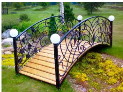
Кованый мостик КМ 18